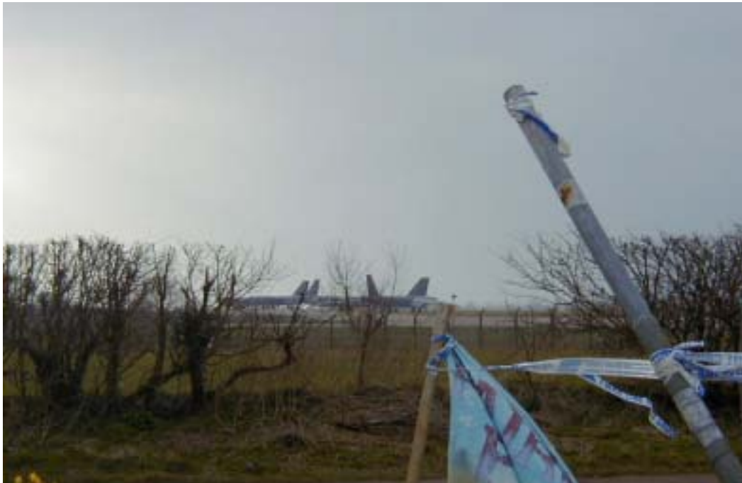
Aviones de transporte de EEUU en Fairford, Gran Bretaña

... y el objetivo de la acción directa noviolenta.