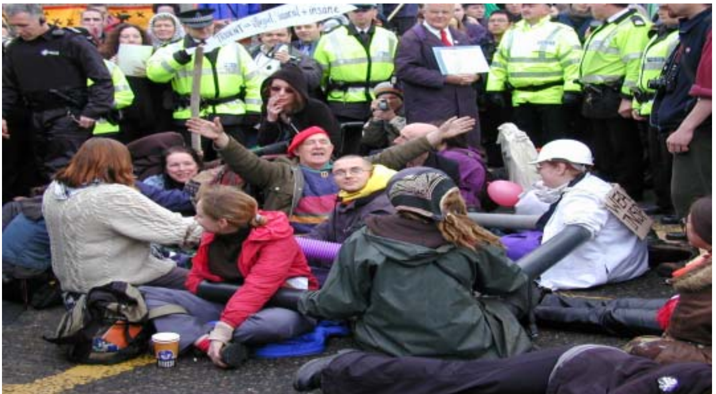
Bloqueada en Faslane, base británica de submarinos nucleares.

► Disarm: El grupo antimilitarista sueco,