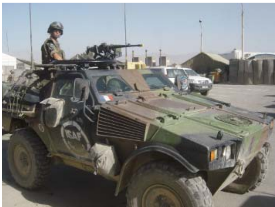
OTAN en Afganistán

Una brigada está asignada permanentemente a este cuartel: la