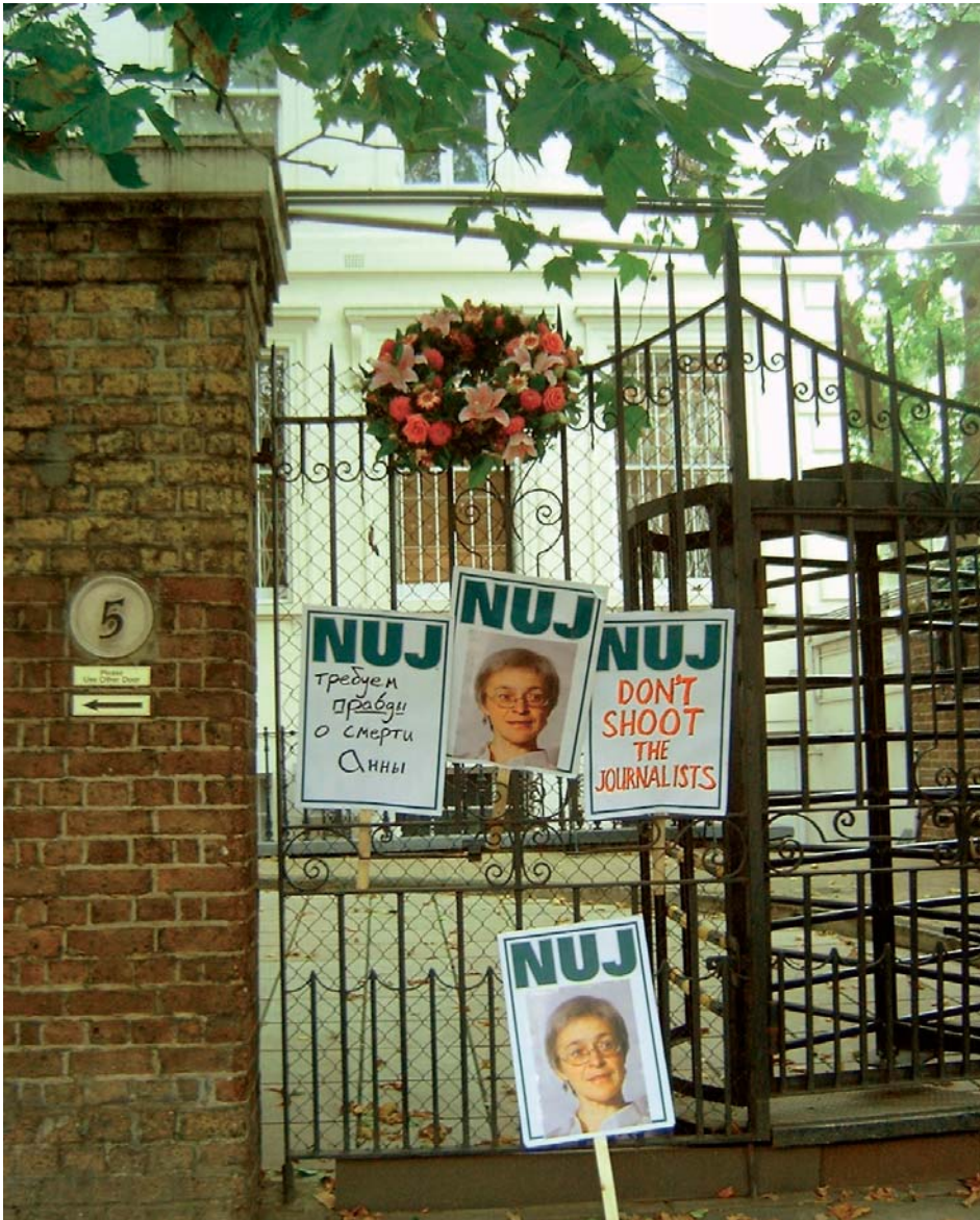
Embajada de Rusia en Londres