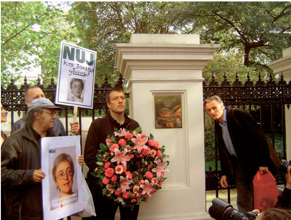
14 de octubre del 2006 en la Embajada de Rusia en Londres. Una delegación del Sindicato Nacional de Periodistas intentan entregar una petición y una corona de flores en memoria de Anna Politkovskaya

El 7 de octubre del 2006, la periodista rusa Anna Politkovskaya, fue asesinada en las afueras de su departamento en Moscú. Este no fue un caso aislado – un número no menor de periodistas han sido asesinados en Rusia en los últimos años - y mucho menos fue una coincidencia que Anna Politkovskaya, fuera esta vez, el objetivo