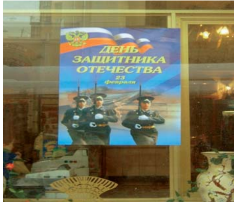
Poster por el "Día de los Defensores de la Madre Patria" el 24 de febrero, pero los defensores no quieren servir más....

De acuerdo a los reportes de la Fundación Derechos de las Madres, "3 mil soldados en promedio mueren cada día en el ejército ruso. [...] 23% de las muertes en el ejército son atribuidas a accidentes, 16% a operaciones militares, 15% por agresiones de otros soldados y 11% a enfermedades. Además, en el 17% de los casos el soldado muerto era el único hijo de la familia, y 14% de los padres que perdieron a sus hijos en el servicio militar son personas discapacitadas. Los padres de un hijo muerto pueden acceder a una pensión que alcanza los 70 U$ mensuales, pero sólo la pueden recibir si se comprueba que la causa de la muerte no fue suicidio