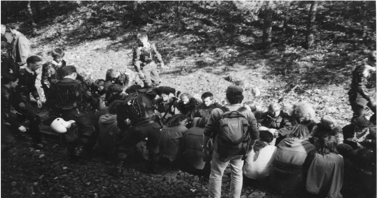
Bloqueo de un tren de desechos nucleares: ¿Cómo llevar personas a los rieles?