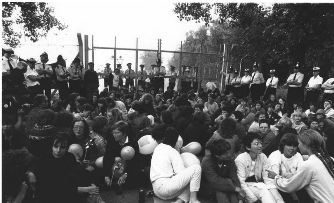
Greenham Common: Mujeres bloqueando la entrada de la base nuclear.