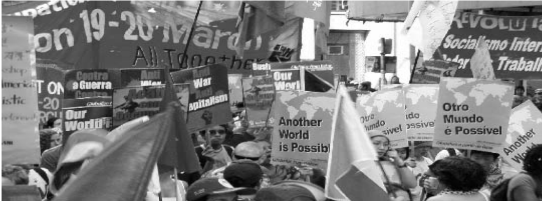
Caracas, Enero 2006: Marcha durante el Foro Social Mundial.