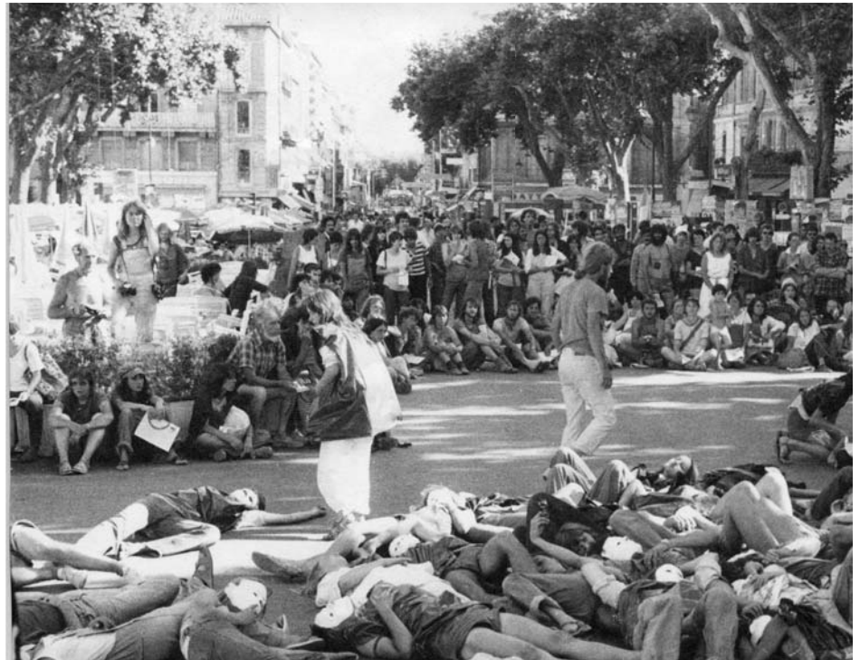
Marcha por la desmilitarización- Aniversario de Hiroshima, teatro callejero.

► El uso de la desobediencia civil se ha hecho más funcional, a mi modo de ver. En Mutlangen se debatieron largo y tendido los argumentos que legitiman la negativa a obedecer en el marco de la carrera armamentística nuclear, por lo que la desobediencia civil es percibida por muchos como la forma de acción más obvia para atraer la atención pública en un grado muy superior al de las manifestaciones habituales. La