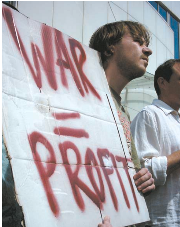
Acción contra EDO en Brighton, UK. 2005

Con esta campaña, la IRG quiere sumarse a la labor de sus afiliados y otros grupos con los que colaboramos. En algunos casos, ciertos miembros de la IRG tienen un mayor contacto entre ellos a través de redes regionales o monográficas que a través de la propia IRG, y así es como debe ser. ¡Nada de monopolios! Sin embargo, estamos convencidos de que nuestra campaña puede sumarse al impulso que ya existe, estableciendo contactos que de otro modo se desaprovecharían, ofreciendo un foro para el intercambio de tácticas y estrategias, y aumentando la colaboración en temas comunes.