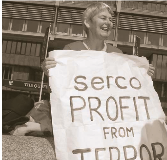
Demostración ante la reunión anual de accionistas de Serco 2005

Las compañías privadas también hoy proveen servicios que eran tradicionalmente exclusivos de los ejércitos - particularmente la seguridad- como los servicios técnicos, de